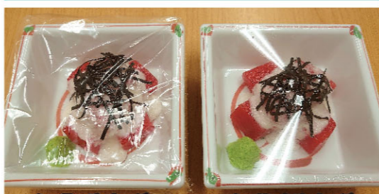
シーラーパッケージ シュリンクパッケージ

※ 市販ビニールよりも透明度の高いフィルムをシュリンクマシンで、一つ一つ丁寧に熱シュリンクを行います。再シュリンクのみの作業にて「セット DE おまかせメンテナンス」よりもリーズナブルな価格設定となっております。