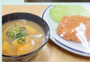
市販のラップフィルムを使用することでホコリを防ぐことができます。