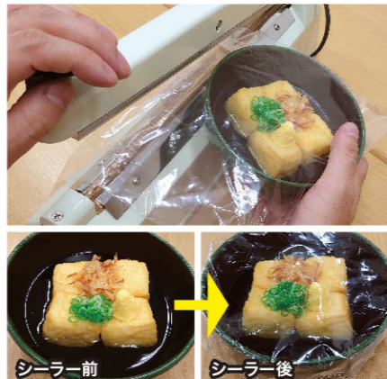
シーラー前 シーラー後

※間口シール長さ: 400mm ※間口シール長さ: 200mmのCS-200 II / 19,000円もごさいます。